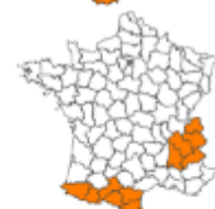
Équipement / Réouverture