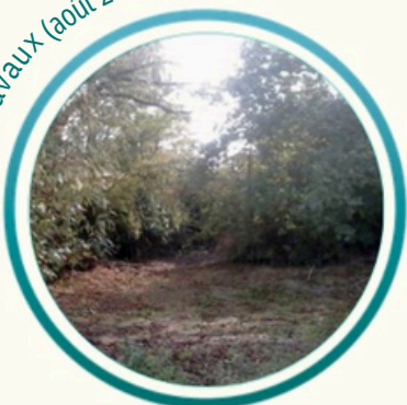
Mare de Pères petit Commune de Montégut-Lauragais (Haute-Garonne)