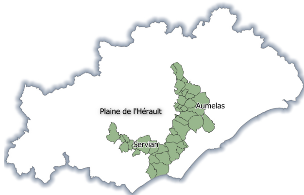
Carte de communes de la Plaine de l'Hérault, bénéficiant d'une animation locale dans le cadre du projet.

gestionnaires déjà mobilisés lors de la précédente phase du projet